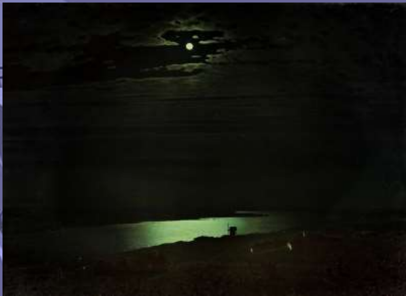
Архип Куинджи "Лунная ночь на Днепре"