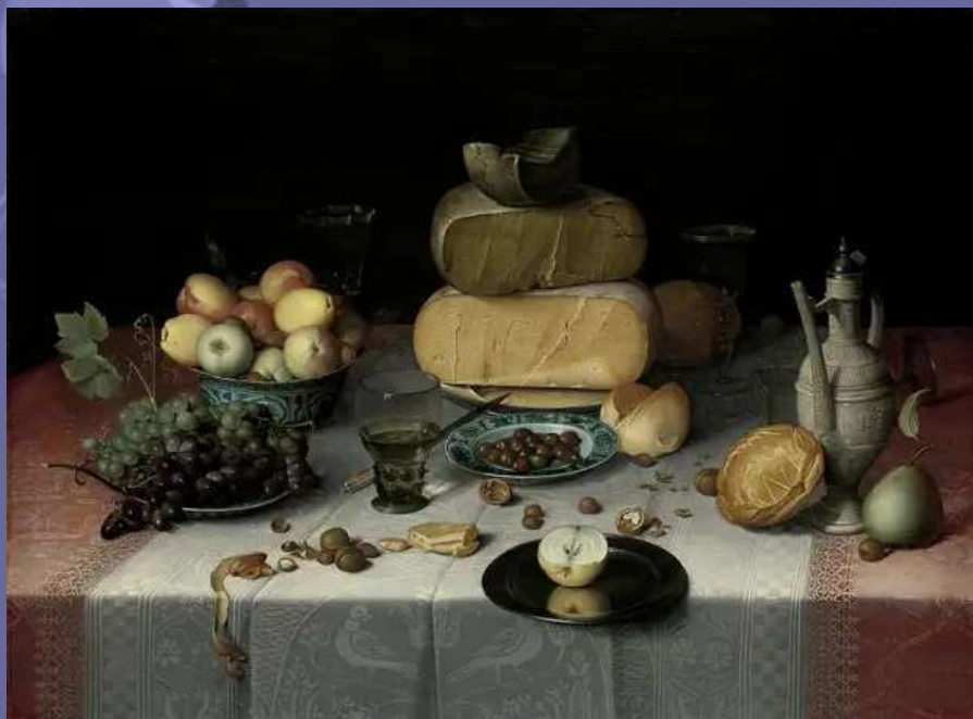
Флорис Ван Дейк «Натюрморт с сырами»