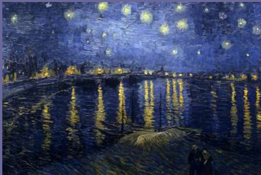
Ван Гог "Звёздная ночь над Роной"