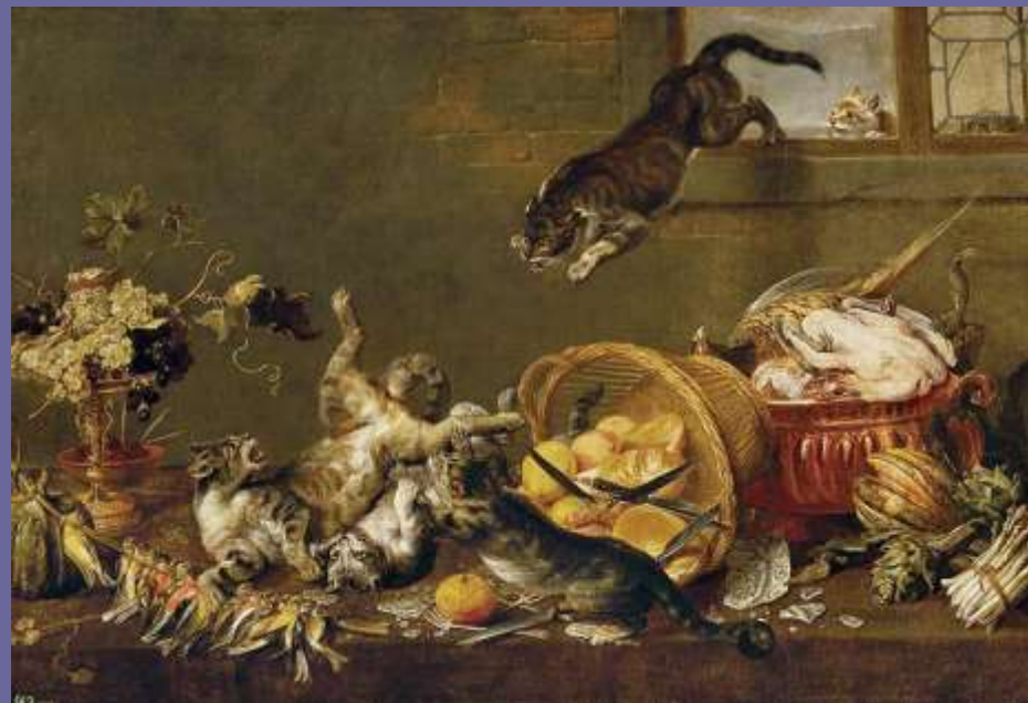
Пауль де Фос «Кошачья драка в кладовой»